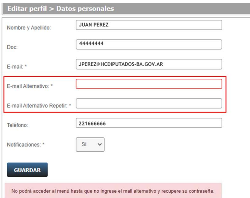
Imagen 1. Acceso a la edición de datos personales.

Las opciones del menú estarán inhabilitadas hasta que presione el botón guardar del formulario.