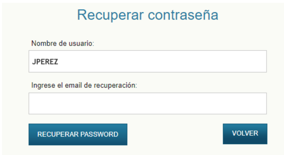
Imagen 4. Recuperar contraseña.

Posteriormente se reenviará un mail de recuperación para el restablecimiento de la contraseña.