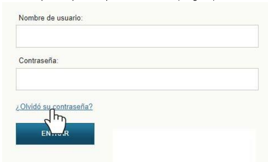
Imagen 3. Olvido de contraseña.

Cuando el usuario olvide la contraseña, oprimiendo la opción correspondiente (imagen 3) se abrirá un apantalla para recuperar la contraseña (imagen 4).