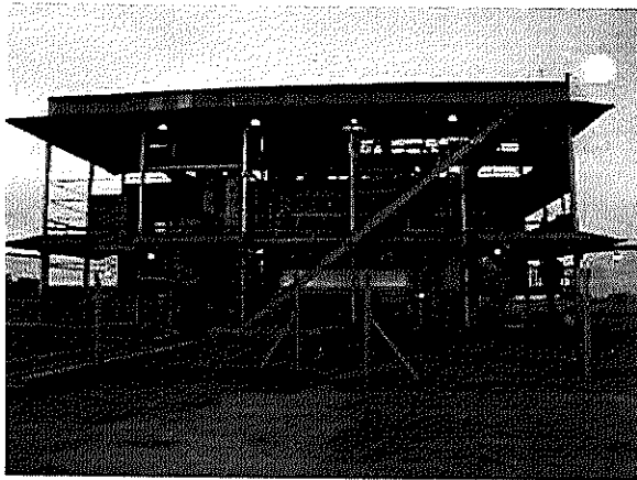
Planta de Oleaginosa Huanguelén que funciona en el parque Industrial Bolívar.

Se ha pensado en establecer una institución educativa de contención de adolescentes. "Es por ventajas geográficas. El traslado al parque industrial bolivarense comenzará a hacerse efectivo el 1º de agosto, y finalizará el 1º de marzo de 2005. La inversión se calcula en 1.800.000 pesos".