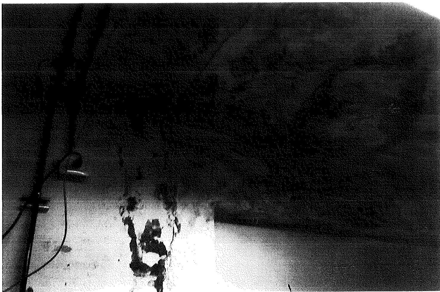
Las filtraciones deterioraron el techos de dos aulas de la escuela, que ahora fueron clausuradas.