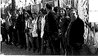
Docentes de Ensenada abrazaron a la Escuela N° 16